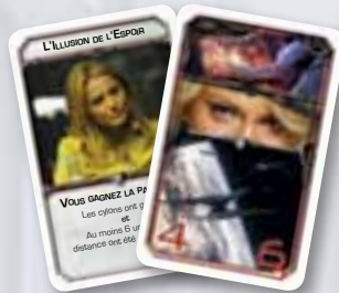
Cartes Projet Compatissant