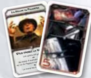
Cartes Projet Hostile

Il ya deux paquets de cartes Projet pour les Leaders Cylons - Hostile et Compatissant. Ces cartes donnent aux Leaders Cylons des objectifs spécifiques qu'ils doivent accomplir pour gagner la partie. C'est le nombre de joueurs qui détermine de quel paquet les Leader Cylons piochent leurs Projets (cf. les règles sur les Leaders Cylons page 10 pour plus de détails).