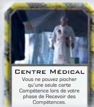
Exemple de lieu dangereux

Les lieux dans des cases aux bords rayés en jaune sont considérés comme dangereux. Ces lieux sont la Cellule, l'Infirmerie, le Vaisseau de Résurrection, le Centre Médical et la Détention. Les joueurs ne peuvent pas se rendre dans les lieux dangereux dans le cadre de leur mouvement normal. Ils ne peuvent aller dans de tels lieux que lorsqu'une carte ou un effet les y envoie.